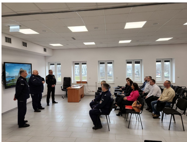
Szkolenie podstawowe strażników - aplikantów Straży Miejskiej

Pozostałe szkolenia zewnętrzne w Straży Miejskiej Miasta Lublin to: